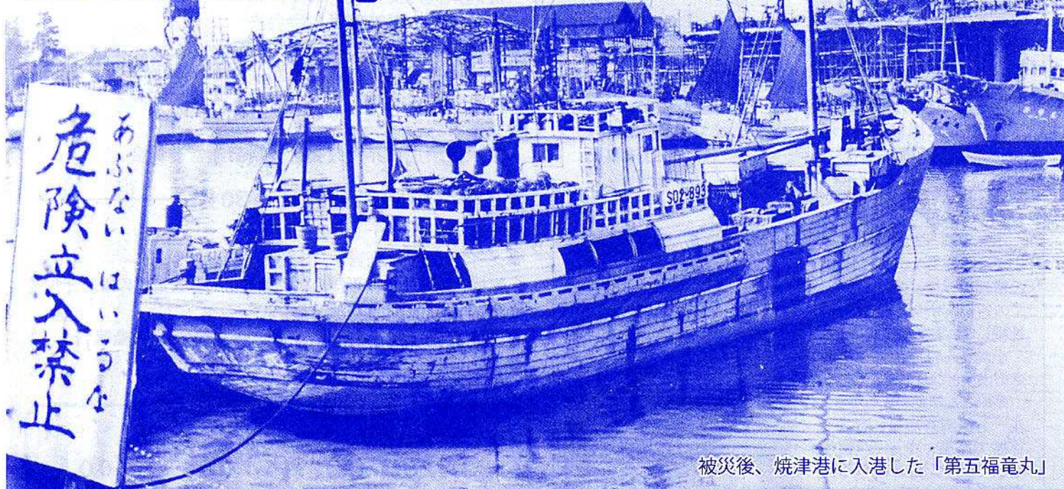
被災後、焼津港に入港した「第五福竜丸」

1954年3月1日、米国は太平洋マーシャル諸島にあるピキニ環礁で水爆実験を行いました。水爆の威力は広島型原爆の1000倍とも言われ、マーシャル島民や近海で操業していた焼津のマグロ漁船第五福竜丸をはじめ多くの漁船の船員に大量の放射能を浴びせました。この「ピキニ事件」をきっかけに、核兵器廃絶の世論と運動が沸き起こりました。「核兵器をなくそう」の運動の出発点となった3月1日を心に刻み、世界に発信しましょう。