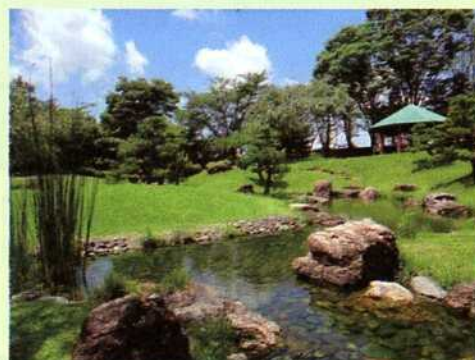
浜北区万葉の森公園