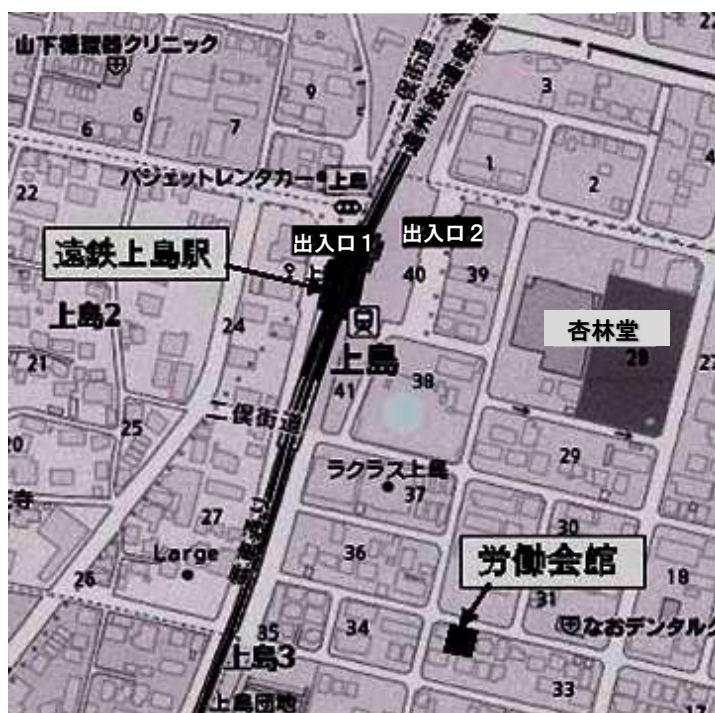
労働会館へのご案内地図

駐車場に限りがありますので、当日は遠鉄電車を利用されるか、付近の駐車場をご利用ください。